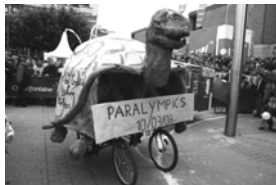
Tortue Gratte à 4 roues: 3ème prix aux 24h!! BRAVO!!

Grâce aux déferlements d'énergie et d'ingéniosité des kots et du nouveau CI, Gratte BW gigote dans tous les sens, se lance dans des projets aussi fou qu'un vélo folklo « Tortue », qu'une newsletter mensuelle, qu'un bal réservé aux vampires,